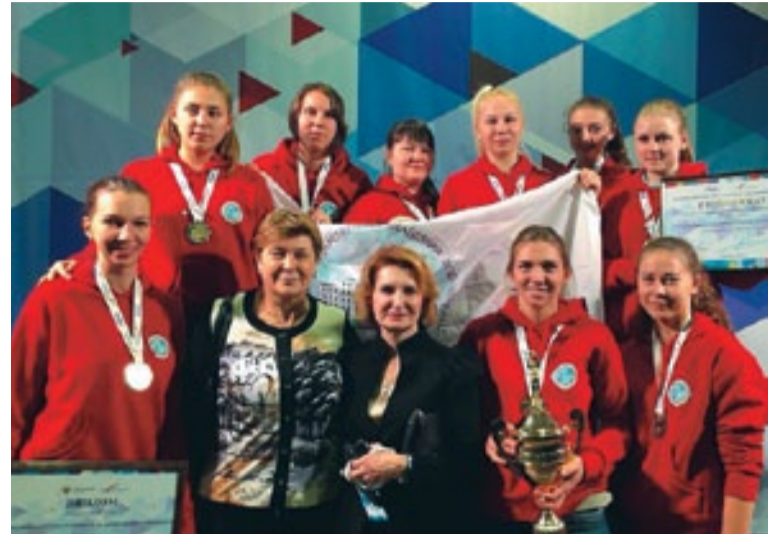
Женская баскетбольная команда ФГБОУ ВО «НГАВТ»